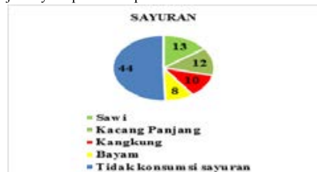
Gambar 4. Distribusi sampel berdasarkan konsumsi sayuran

Sebanyak 36 sampel mengonsumsi sayuran, jenis sayuran yang sering dikonsumsi sampel adalah sawi, kacang panjang, kangkung, dan bayam. Lebih jelasnya dapat dilihat pada Gambar 4.