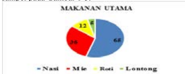
Gambar 1. Distribusi sampel berdasarkan konsumsi makanan utama

Kecukupan jumlah konsumsi energi berdasarkan AKG Tahun 2014 untuk usia 16 – 18 tahun yaitu 2675 kkal untuk laki-laki dan 2125 kkal untuk perempuan. Hasil penelitian menunjukkan bahwa jumlah asupan energi sampel sebagian besar kurang (78,3%) dengan jenis makanan yang tidak seimbang (96,6%) dan frekuensi makan yang tidak baik (97,7%). Selain karena tingkat pengetahuannya kurang mengenai Pedoman Gizi Seimbang, hal ini juga dikarenakan sampel lebih memilih makanan yang sedang trend saat ini dan praktis serta yang dia sukai tanpa mempertimbangkan kebutuhan dan kandungan zat gizinya. Selain itu, sampel juga memiliki aktifitas yg cukup padat sehingga jadwal makan sering terlewatkan. Berikut ditampilkan gambaran jenis makanan yang dikonsumsi sampel pada Gambar 1-5.