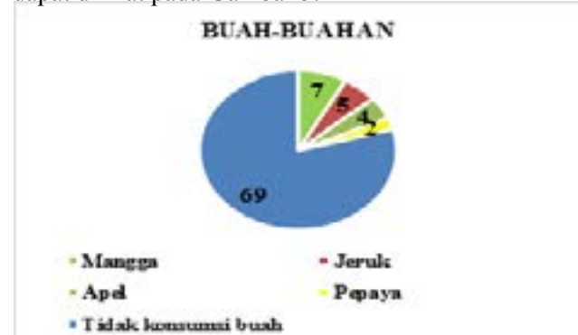
Gambar 5. Distribusi sampel berdasarkan buah-buahan

Hanya 31% sampel mengonsumsi buah-buahan, jenis buah-buahan yang biasa dikonsumsi sampel adalah mangga, apel, jeruk dan pepaya. Lebih jelasnya dapat dilihat pada Gambar 5.