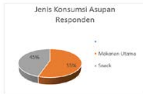
Grafik1. Gambaran Konsumsi Responden

Hasil rerata asupan zat gizi menunjukkan asupan energi rerata sebanyak 1175,9 kkal dengan asupan yang paling rendah sebanyak 531,5 kkal dan tertinggi 2589,4 kkal. Asupan karbohidrat rerata menunjukkan sebanyak 148,4 gram dengan asupan minimal sebanyak 57,2 gram dan asupan maksimal sebanyak 148,4 gram. Asupan lemak menunjukkan rerata sebanyak 46,9 gram dengan asupan minimal sebanyak 16,6 gram dan asupan maksimal sebanyak 139,1 gram. Asupan natrium pada responden rerata sebanyak 187,3 gram dengan asupan minimal 75,5 gram dan asupan maksimal 284,8 gram.