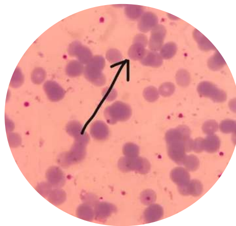
Gambar 1. Eritrosit terinfeksi Plasmodium falciparum stadium trophozoit muda (pewarnaan Giemsa 3%, perbesaran 1000× dengan minyak imersi). Tanda panah menunjukkan bentuk cincin dengan kromatin ganda.

Spesies Plasmodium yang paling banyak ditemukan adalah Plasmodium falciparum sebanyak 13 sampel (46,4%). Stadium parasit yang teridentifikasi pada pemeriksaan mikroskopis adalah stadium trophozoit.